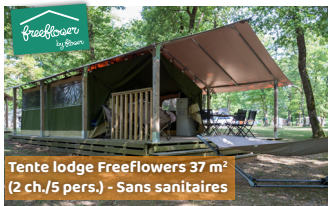
Tente lodge FreeFlowers 37 m 2 (2 ch./5 pers.) - Sans sanitaires