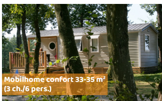
Mobilhome confort 33-35 m 2 (3 ch./6 pers.)