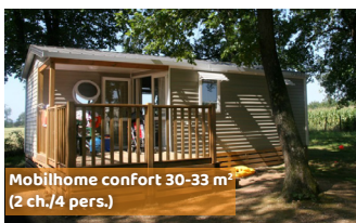
Mobilhome confort 30-33 m 2 (2 ch./4 pers.)