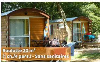
Roulotte 20 m 2 (1 ch./4 pers.) - Sans sanitaires